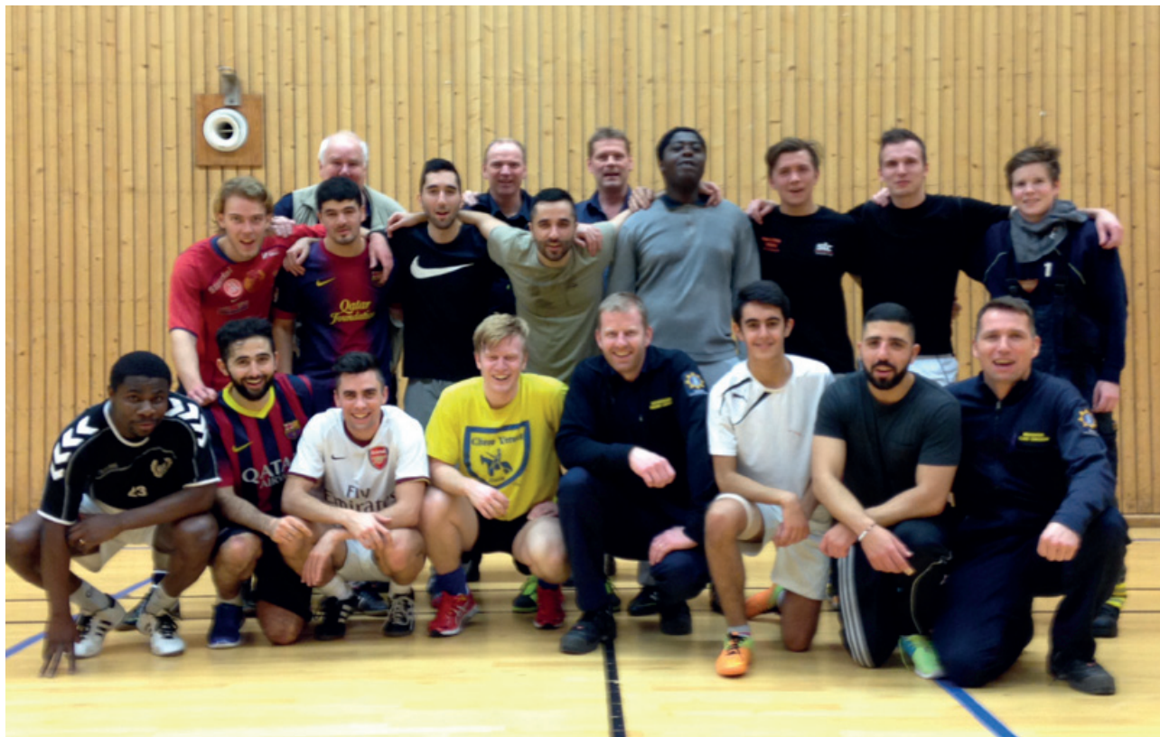
Gemensam träning med FC Komarken.

Förutom ett administrativt deltagande i olika grupper så arbetar förbundet mycket med att möta ungdomarna. Förbundet är bland annat aktiva med att besöka fritidsgårdar samt stödja och deltaga i idrottsevenemang. Att tillsammans med ungdomarna planera för trygga och säkra miljöer i anslutning till helgdagar/långhelger/skollov och övriga evenemang är en självklarhet i det dagliga förebyggande arbetet. Förbundet har även bjudit in ungdomar till brandstationerna för att vid dessa tillfällen informera, utbilda samt knyta goda relationer.