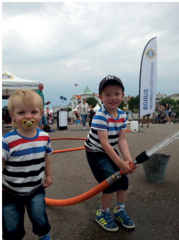
Swedish Match i Marstrand 2014 – tillfälle att ge allmänheten information och rådgivning.

Informationsaktiviteter har genomförts i samverkan med systembolagen i de bägge kommunerna. Förbundet har under året varit en aktiv aktör i kommunernas arbete gällande äldresäkerhet, genom arbetsgrupper, föreläsningar etc. Under året har ca 4000 personer fått ta del av information genom möten med förbundets personal.