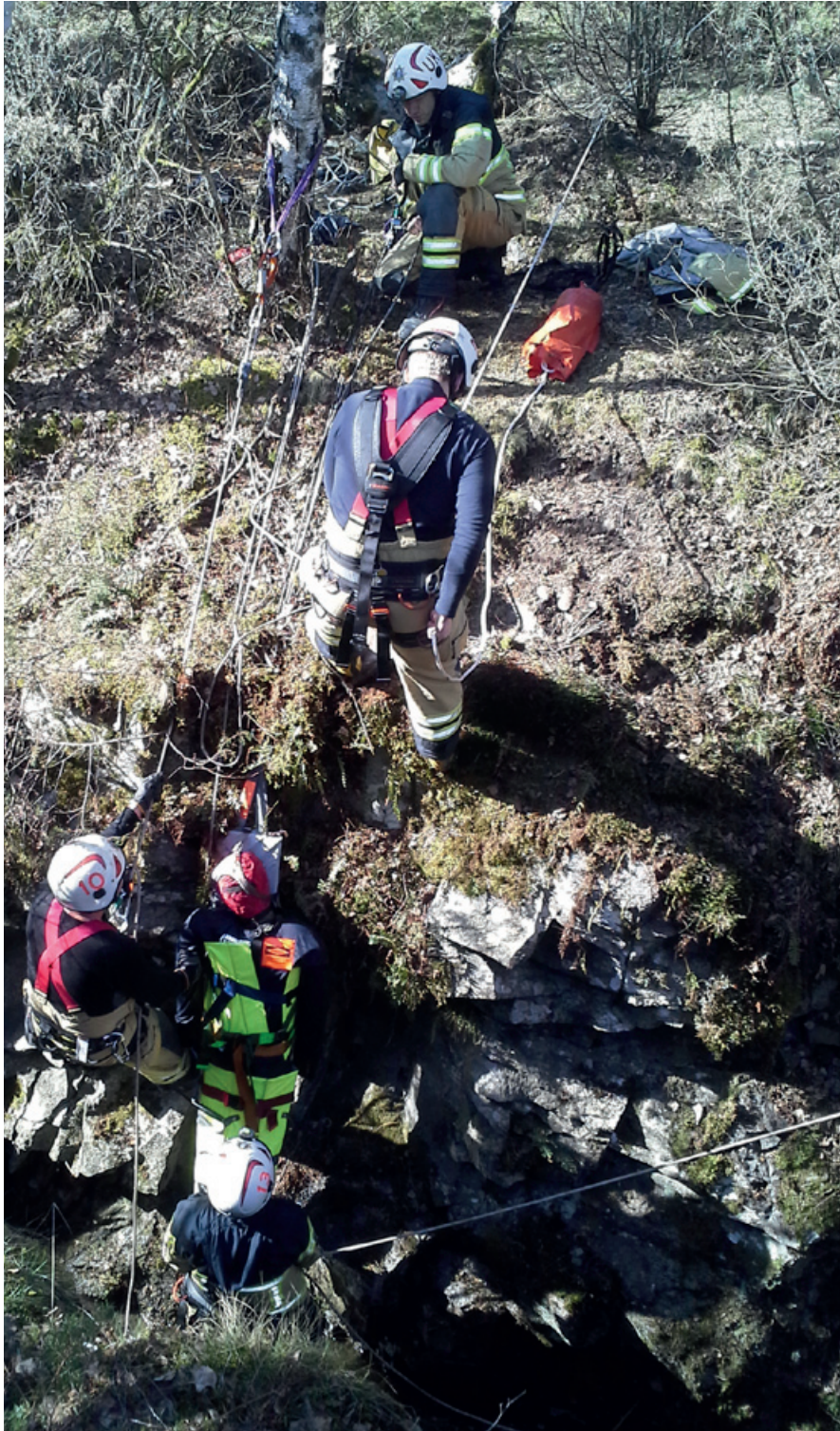
Livräddningsövning i svår terräng.